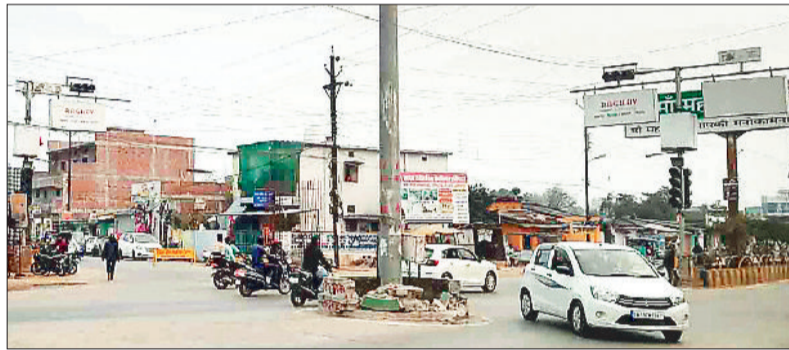
महामाया प्रवेश द्वार। जिसका निर्माण कार्य माह भर से रुका हुआ है।

शहर के साथ ही जिले की आस्था के प्रतीक महामाया मंदिर के भव्य प्रवेश द्वार का मामला उंडा पड़ गया है। धूमधाम से भूमिपूजन किए जाने के बाद द्वार निर्माण के लिए नींव तो रख दी गई लेकिन इसके बाद द्वार के निर्माण का कार्य आगे नहीं बढ़ पा रहा है। द्वार निर्माण के लिए ठेकेदार द्वारा कॉलम में छड़ डालकर छोड़ दिया गया है जिससे निर्माण कार्य महीने भर से रुका हुआ है। निर्माण में लेटलतीफी व अधिकारियों की उदासीनता को लेकर भी सवाल उठाए जा रहे हैं।