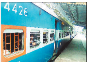
तीसरी लाइन कनेक्टिविटी कार्य का असर

रेलवे का कहना है कि कार्य के पूरा होते ही गाड़ियों के परिचालन में गतिशीलता आएगी। 10 से 16 जनवरी तक चिरमिरी से रवाना होने वाली गाड़ी संख्या 08269 चिरमिरी-चंदिआ रोड पैसंजर स्पेशल और चंदिआ रोड से रवाना होने वाली गाड़ी संख्या 08270 चंदिआ रोड-चिरमिरी पैसंजर स्पेशल रद्द रहेगी। इसी तरह 11,13 और 16 जनवरी को चिरमिरी से रवाना होने वाली गाड़ी संख्या 05755 चिरमिरी-अनुपूर पैसंजर