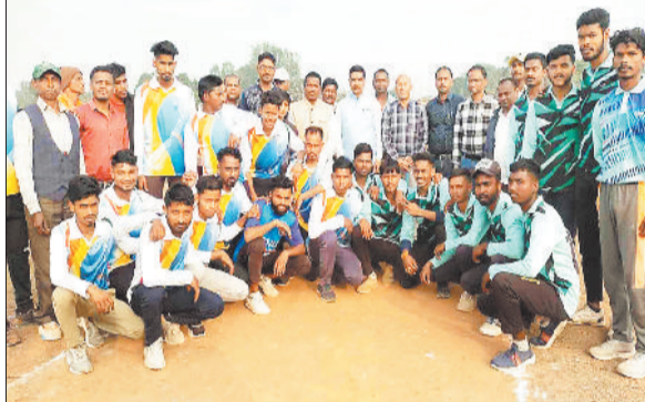
अतिथियों के साथ खिलाड़ी।

ग्राम मानी में आयोजित क्रिकेट प्रतियोगिता का आज फाइनल मुकामबला हरि टिकरा व सपकरा के मध्य खेला गया जिसमें सपकरा की टीम जीत हासिल कर खिताब अपने नाम किया। सपकरा की टीम टॉस जीतकर पहले बल्लेबाजी करने का निर्णय लिया और निर्धारित 12 ओवर में शानदार बल्लेबाजी का प्रदर्शन करते हुए 91 रन बनाकर हरि टिकरा की टीम को 92 रनों का लक्ष्य दिया।