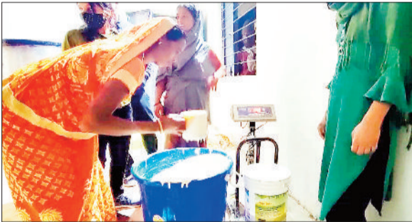
पेंट को बिक्री के लिए तैयार महिलाएं।

जिला मुख्यालय बैकुंठपुर से लगे हुए ग्राम पंचायत मझगांव स्थित गौटान में बनाए गए ग्रामीण औद्योगिक पार्क में गोबर पेंट बनाकर आने तक समूह की महिलाओं ने 14 लाख 80 हजार रूपए का व्यवसाय किया है। इस गोबर पेंट विक्रय से अब तक समूह की महिलाओं को लगभग 3 लाख रूपए से ज्यादा का