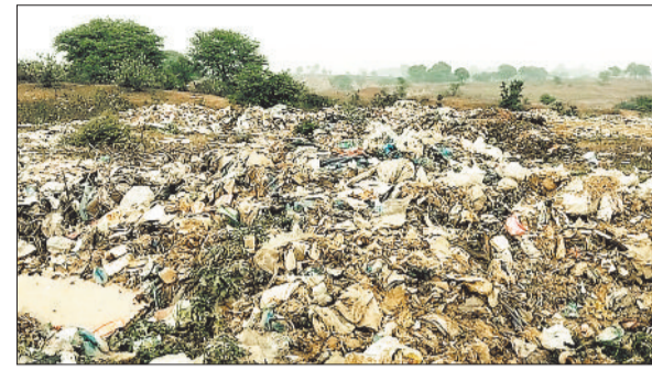
तलवापारा स्थित एसएलआरएम सेंटर के पास फैला कचरा।

दोनों जिलों में अब तक 19658 से अधिक किसानों से 1041457.6 क्विंटल धान की खरीदी की जा चुकी है। इसमें खरीदी के लिए राज्य शासन द्वारा एक अरब 227 करोड़ 35 लाख 1940 रूपए का भुगतान किया गया है। इस भुगतान में से 45 करोड़ 95 लाख 67759 रूपए की ऋण वसूली की जा चुकी है।